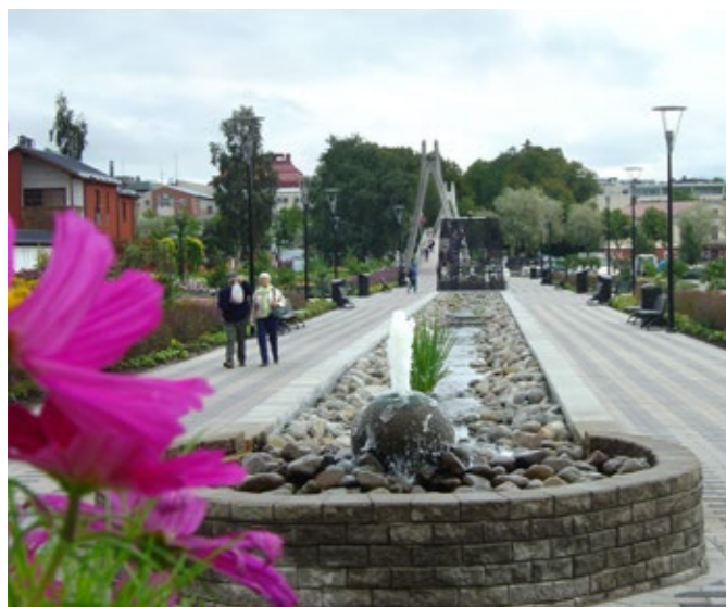
August Eklöfin puisto (Valtiopäiväpuisto), Porvoo.