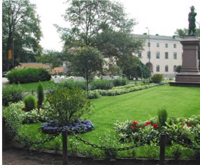
Brahenuisto, Turku.