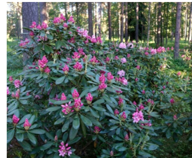
Tuiranpuisto, Oulu.

Puistot ovat merkityksellisiä ja rakkaita. Ne ovat monelle paras pala kaupunkia, kuten rovaniemeläinen vastaaja toteaa. Puistot ovat monelle kaupungin sydän, keuhkot, henkireikä, helmi tai keidas. Viheralan ammattilaisina meillä on huoli puistoista ja niiden tulevaisuudesta. Kaupunkirakenne tiivistyy. Miten vastaamme jatkossa ihmisten toiveisiin helposti saavutettavista ja käytettävistä puistoista? On tärkeää, että pidämme sydämen sykkivänä, keuhkot täynnä ilmaa ja arvokkaan helmen kauniina ja ehjänä. ■