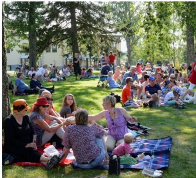
Kaskisten kaupungipuisto, Kaskinen.