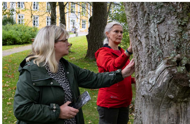
Järjestöpäivät Mustion Linnassa.