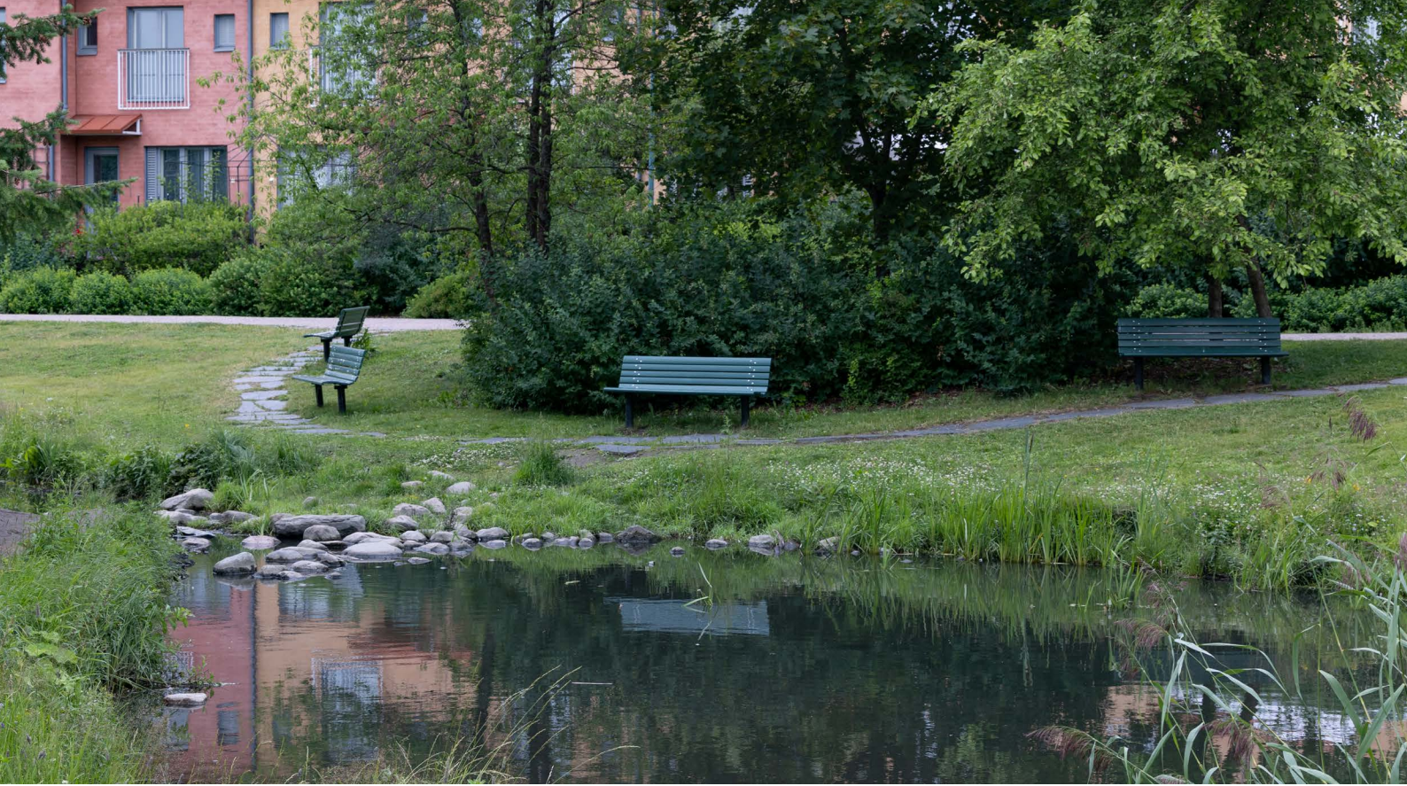
Kartanonkoski, Vantaa.