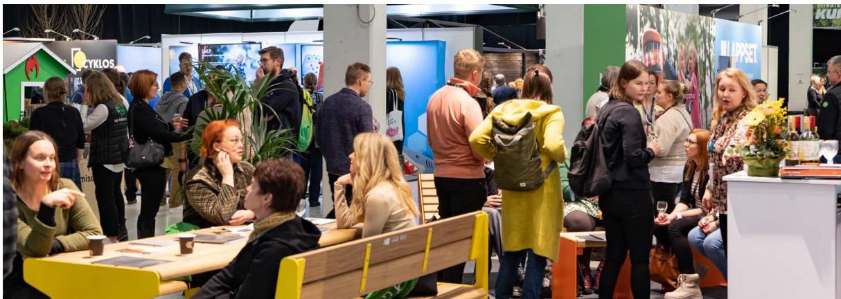
Viherpäivät järjestettiin Jyväskylässä 8.-9.2.2023 kahden vuoden tauon jälkeen.