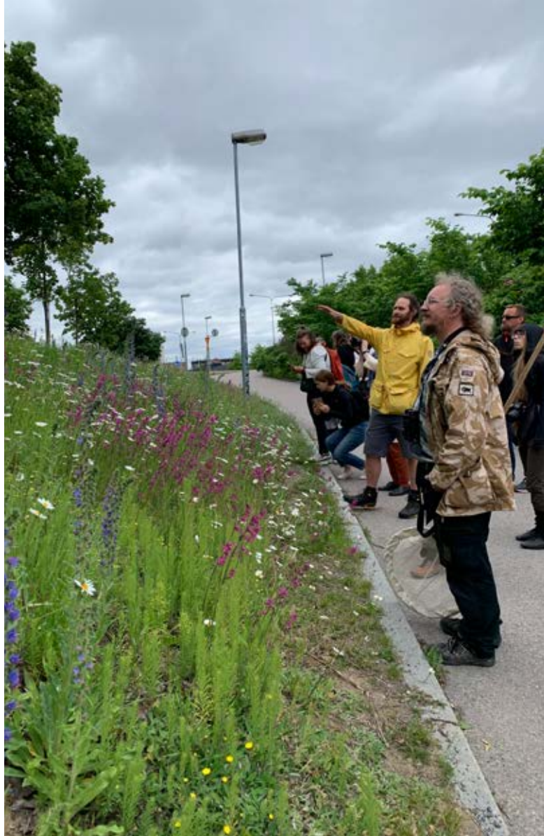
Viherp@iv@t-verkkotapahtuma käynnissä (ylä vasen). LUMO-webinaarisarjaan liittyvä niittyretki Tampereella (oikea). Metsä- ja viherpäivät Lahdessa (ala vasen).