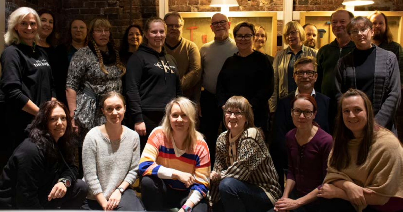
Järjestöpäivien osallistujia Billnäsin ruukissa.

Uutiskirjeet (VYL uutiskirje, VYL jäsenkirje ja Viherympäristö-lehden uutiskirje): Uutiskirjeitä lähetettiin säännöllisesti: