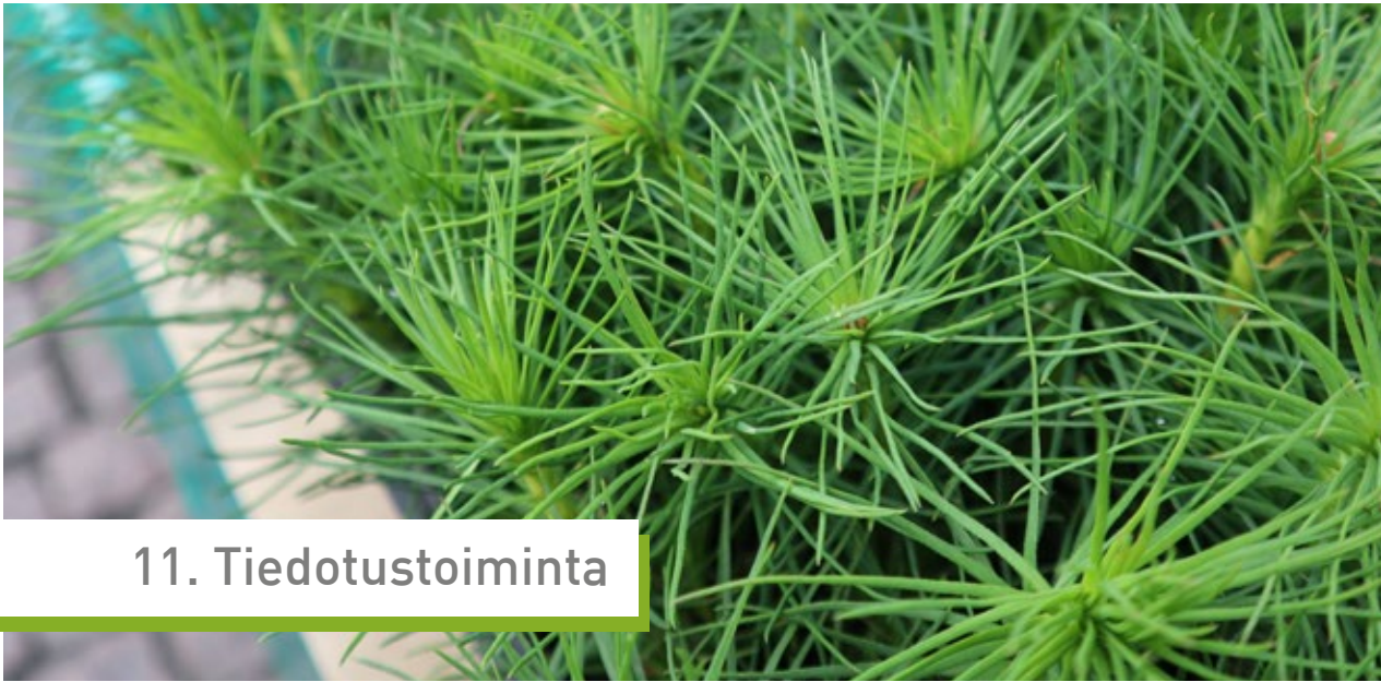
Miljoonan puun talkoot 2019, jaettavia mäntyjä.