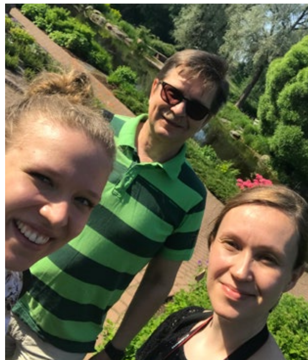
Toimiston Kiiky -päivä Kotkassa.