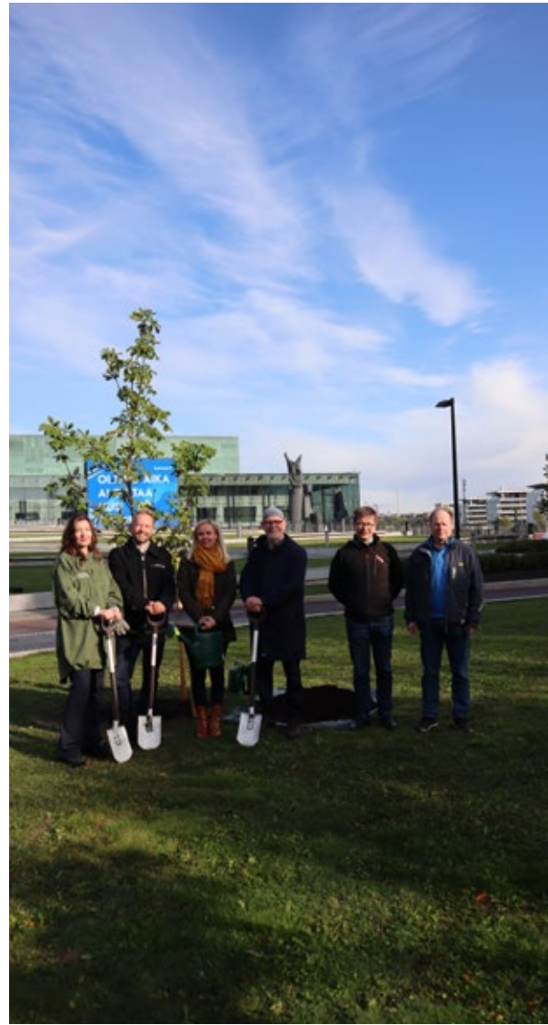
Miljoonan puun talkoot 2019, muistopuun istutus Kiäsmälle.

VYL oli mukana yhteistyökumppanina taiteilija Nina Backmannin puiden istutustapahtumassa Miljoonan puun talkoot. Hallitus päätti syksyllä 2019, että liitto ei ole jatkossa mukana tässä kampanjassa.