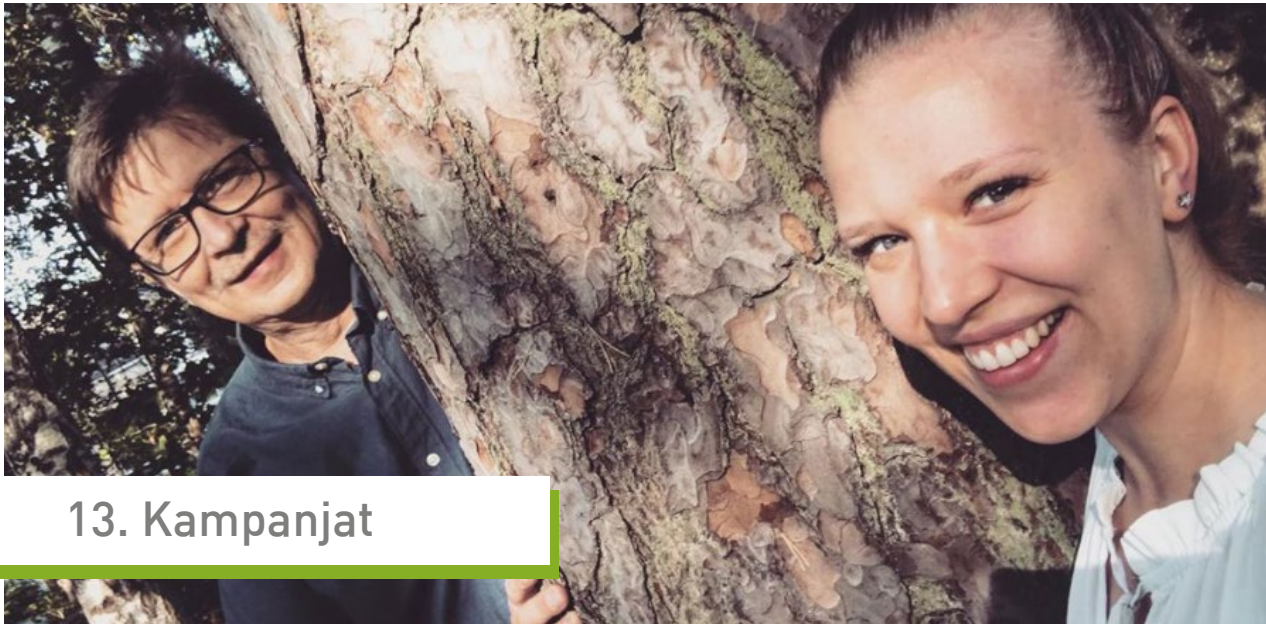
Viherympäristöliiton toimisto halaa lähipuiston puuta Malmilla.