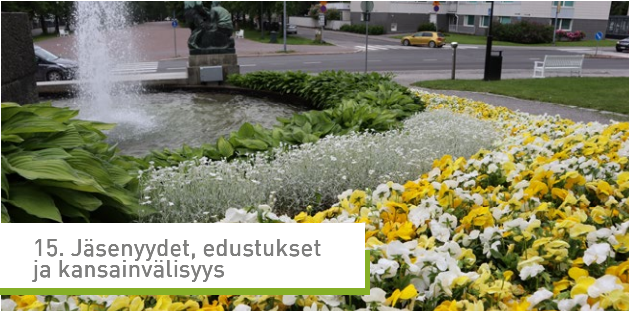
Näsinpuisto, Tampere.