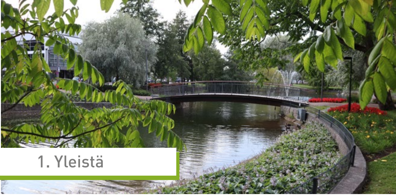
KPS Kesäluento-päivät Forssa.