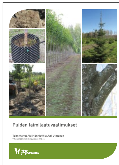
Viherympäristöliiton valmistuneet julkaisut 2019