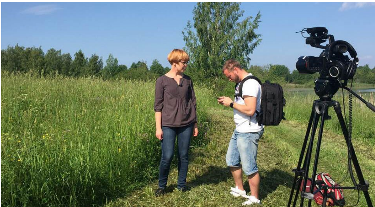
Niityvideo valmistelussa.