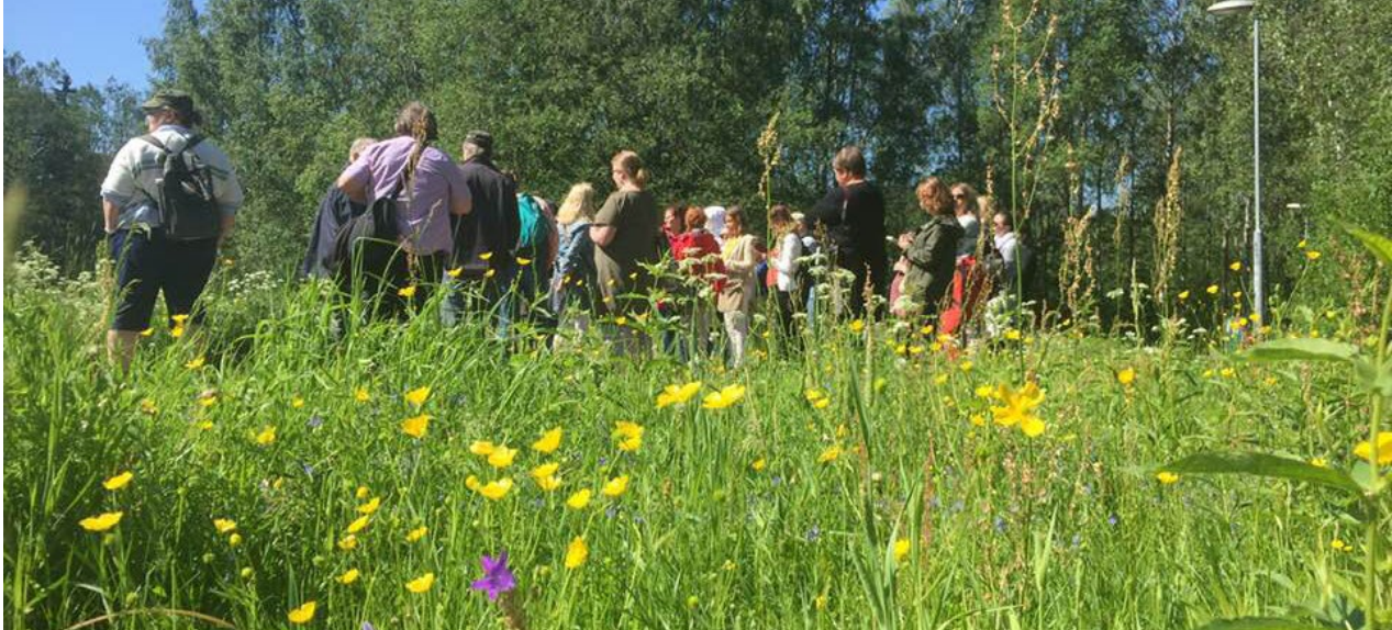
Viherb-hankkeen näyttökset saavuttivat suursuosion.

tä. Seppo Närhi kertoi liiton ajankohtaisista asioista sekä työryhmien ja toimikuntien puheenjohtajat esittelivät omaa toimintaansa.