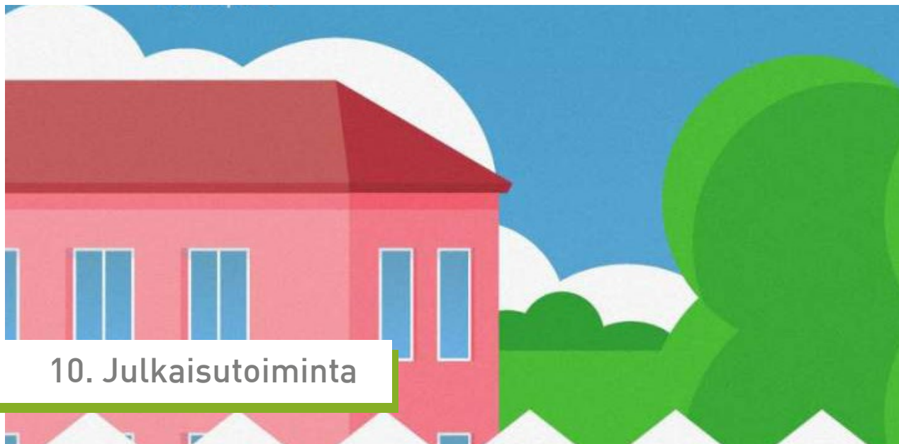
Kuva: Vihreän Kirjan kansi 2019