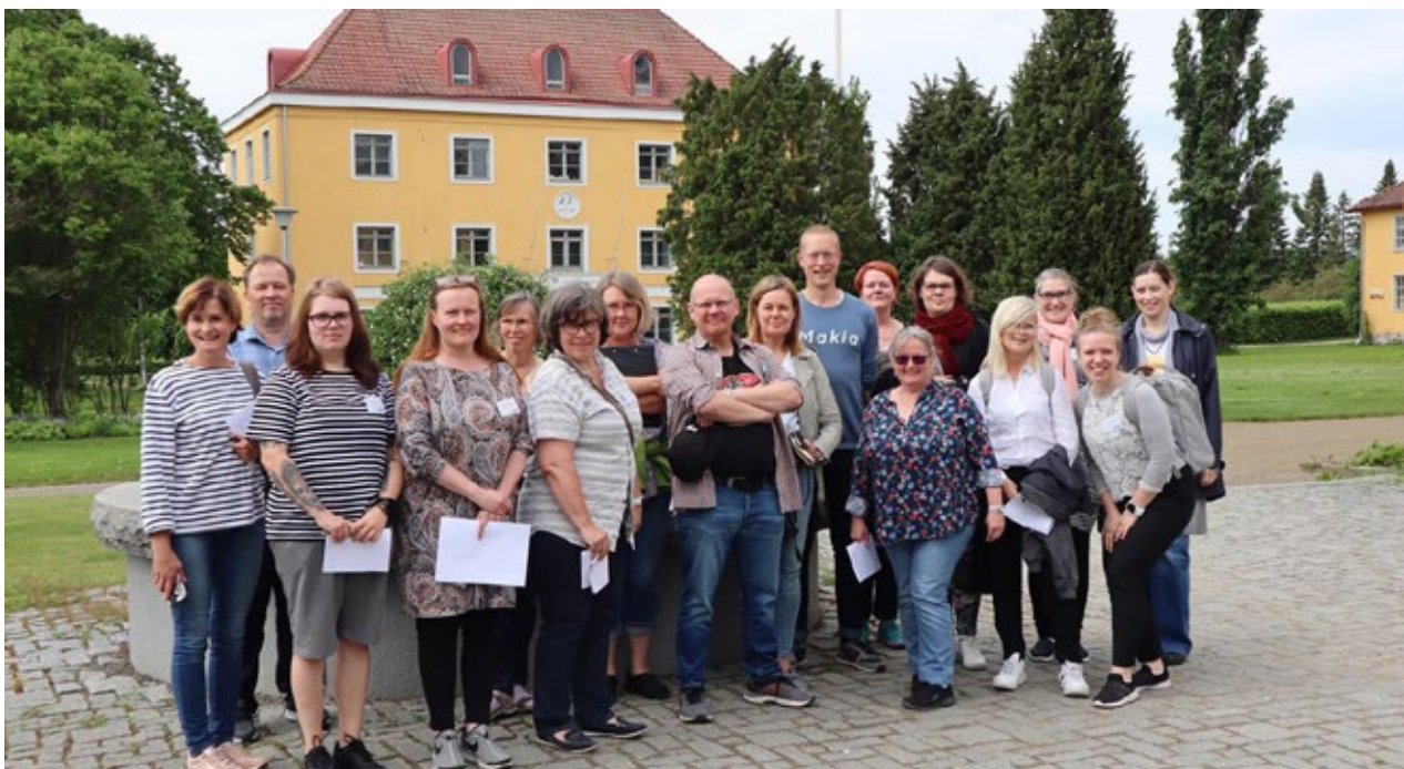
Green Flag-tuomarikoulu Lepaalla.