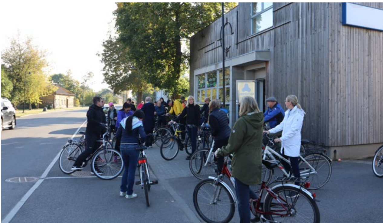
Viherympäristöliiton järjestöpäivät Saarenmaalla.

Liitto järjesti jäsenyhdistystensä kanssa liiton järjestöpäivän Saarenmaalla 26.–28.9. Järjestöpäivän aikana ideoitiin ryhmätyönä liiton strategian jalkauttamista käytännön toiminnaksi ja toiminnan painopisteitä lähivuosina. Toisena keskeisenä päivien teemana oli viestintäsuunnitelman esittely. Viherympäristö-lehden teemoista käytiin keskustelua. Lisäksi keskusteltiin liiton ja sen jäsenyhdistysten välisestä yhteistyös-