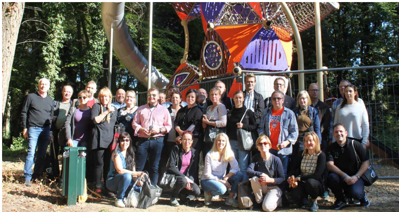
Viherympäristöliiton järjestöpäivät Berliinissä