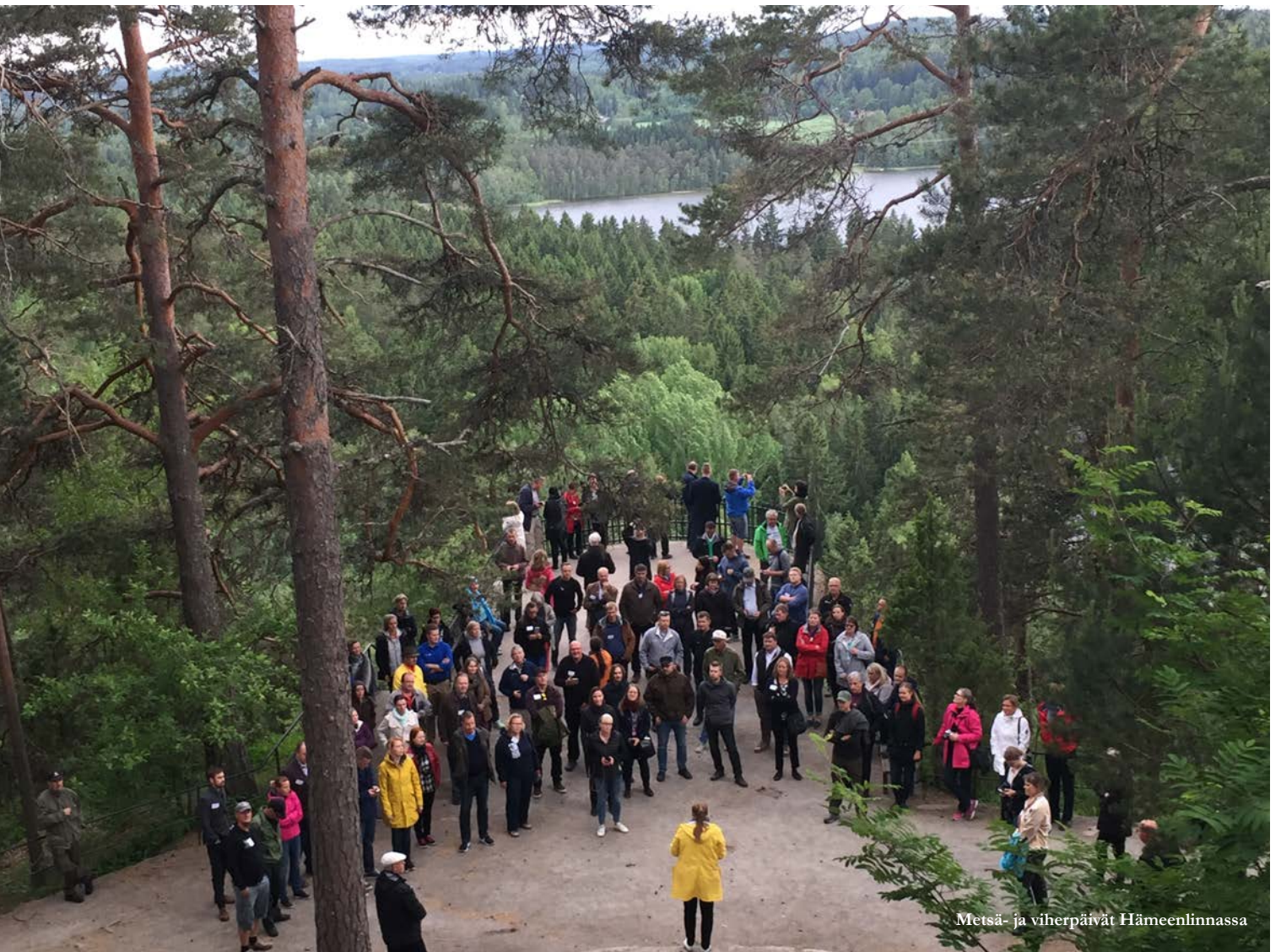
Metsä- ja viherpäivät Hämeenlinnassa