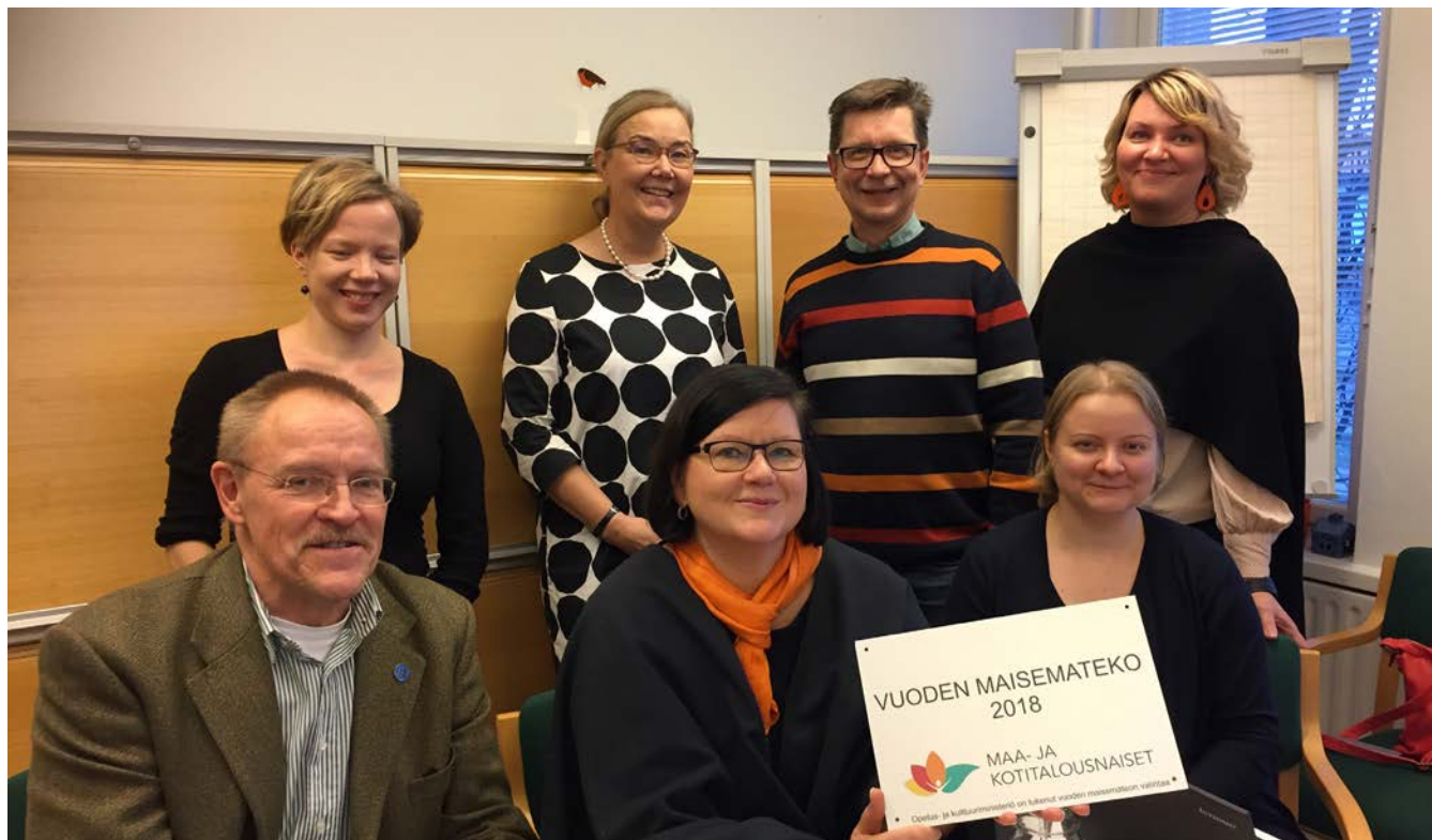
Vuoden maisemateko -kilpailun tuomaristo.